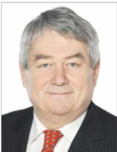
a nemuset řešit žádné problémy.