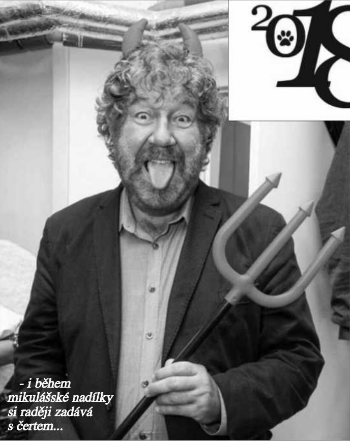
- i během mikulášské nadílky si raději zadává s čertem...